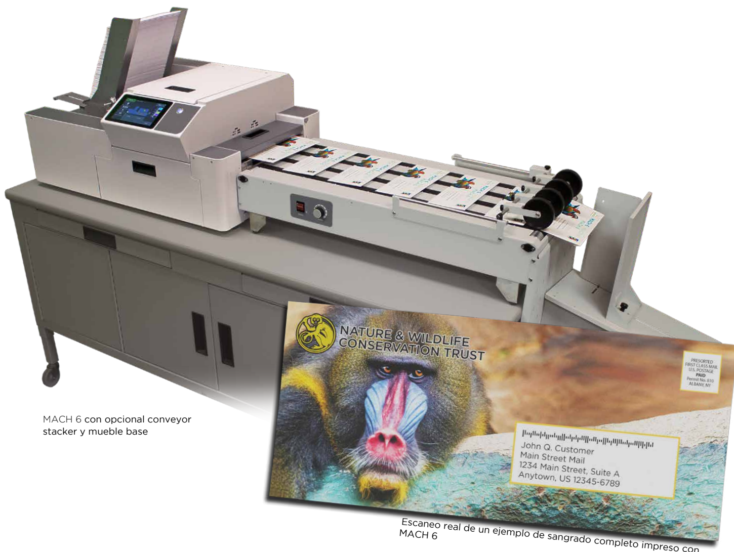
MACH 6 con opcional conveyor stacker y mueble base

Escaneo real de un ejemplo de sangrado completo impreso con MACH 6