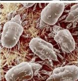
Ácaros y similares