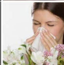
Polen y alérgenos