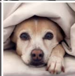
Pelo de su mascotas