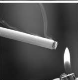
Humo de cigarrillos