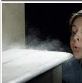
Polvo y partículas flotantes