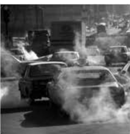
Emissiones de automóviles