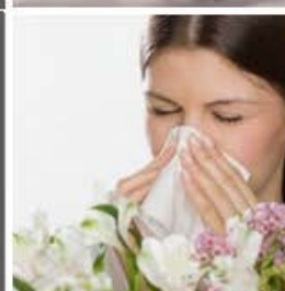
Polen y alérgenos