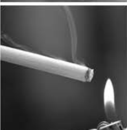
Humo de cigarrillos