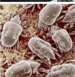
Ácaros y similares