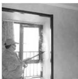
Contaminación del hogar