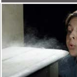
Polvo y partículas flotantes