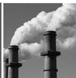
Contaminación de las industrias