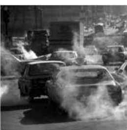
Emissiones de automóviles