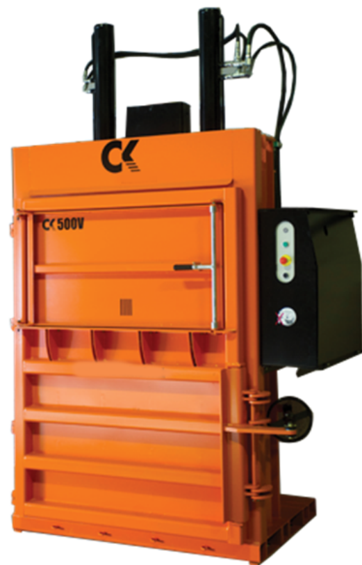
CK500V Cumple con EN16500 - Normas europeas para prensas verticales.