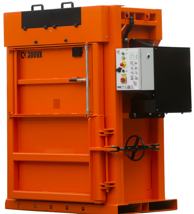
CK300VX Cumple con EN16500 - Normas europeas para prensas verticales.