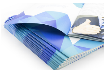
Grapado perfecto con ajuste "fino"