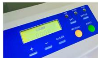
Pantalla de uso fácil e intuitiva