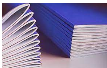
El lomo cuadrado le permite apilar más ya sea para guillotinar o empaquetar.