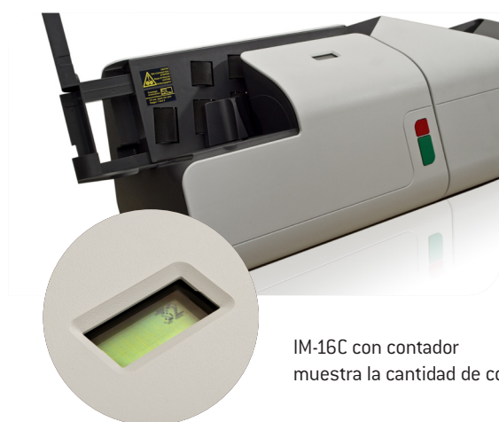
IM-16C con contador muestra la cantidad de correo entrante

Con su método de apertura innovador, la IM-16 elimina desperdicios sin dejar restos de papel por toda la oficina. Su tamaño compacto facilita su ubicación en la oficina, también facilita su desplazamiento y almacenaje.