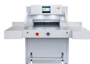
INTIMUS 7310 EPS