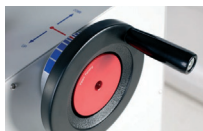
Manibela de Presión