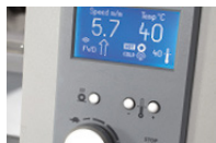
Panel de Control Digital