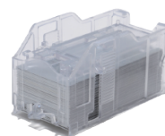
Cartucho 5.000 grapas