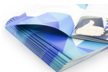
Grapado con acabado profesional