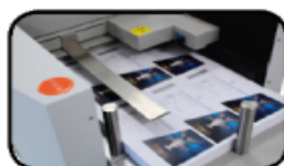
Alimentador de pila profunda