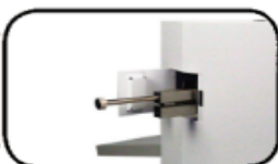
Barra de perforación transversal