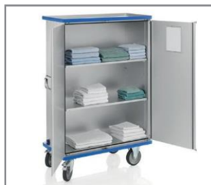
Ejemplo de aplicación

Residencias de ancianos, hospitales, farmacias, industria y más.