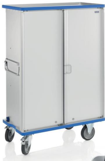
Carro de armario G®-CUP E 2724