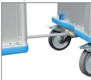
Sistema de remolque