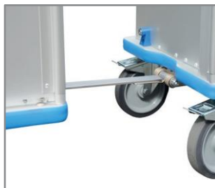
Sistema de remolque