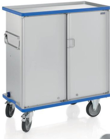
Carro Armario G®-CUP E 2723