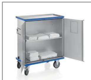
Ejemplo de aplicación