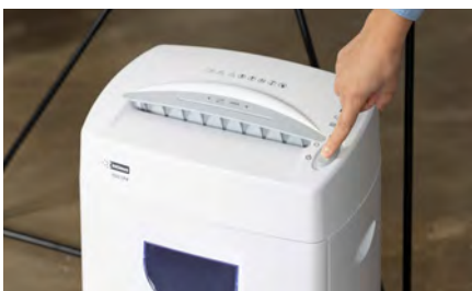
Función de inicio/parada automática y tecnología anti atasco de papel.