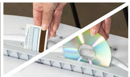
Las tarjetas de crédito y los CD se pueden triturar a través de una ranura de alimentación separada.