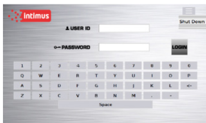
Inicio de sesión seguro