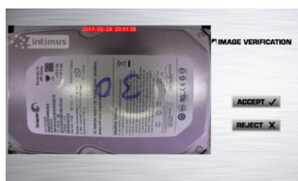
Aceptación o rechazo de imagen