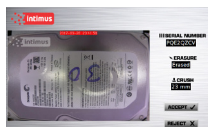
Prueba de imagen de borrado