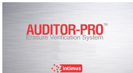
Pantalla de inicio