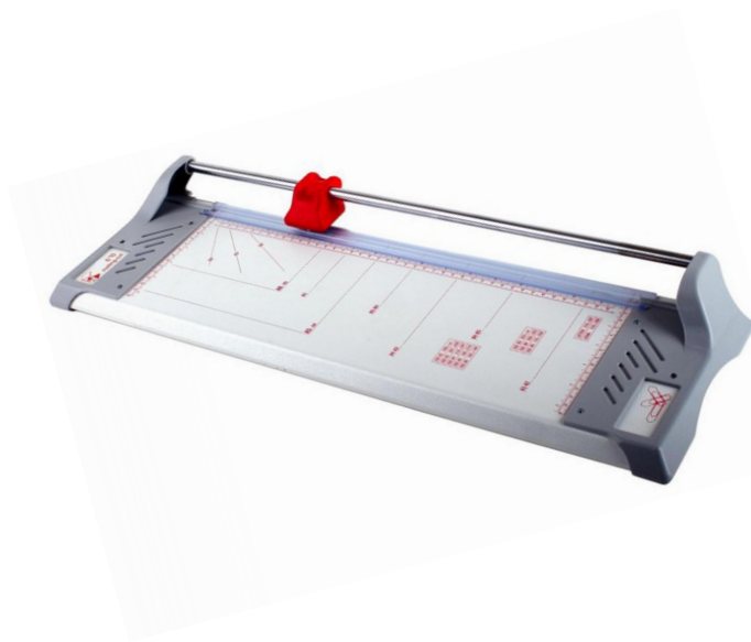
Dimensiones 670 (An x Pr x Al) 855 x 200 x 70 mm Peso 2.1 Kg

Cizalla de rodillo con base de construcción metálica con margenes en platico reforzado. Cabezal de corte de seguridad ergonómico con cuchilla de acero endurecido. Pisón de sujeción transparente y automático. Pintura en polvo anti arañazos. Escuadra extensible con escala en milímetros y pulgadas. Transportador con indicaciones de alineación en la barra de sujeción y en la tabla de corte para cortes angulares precisos. Regla en cm y pulgadas de medida en la mesa de corte. Construcción sólida y resistente a golpes. Ancho de corte A2. Capacidad de corte 12 / 8 hojas.