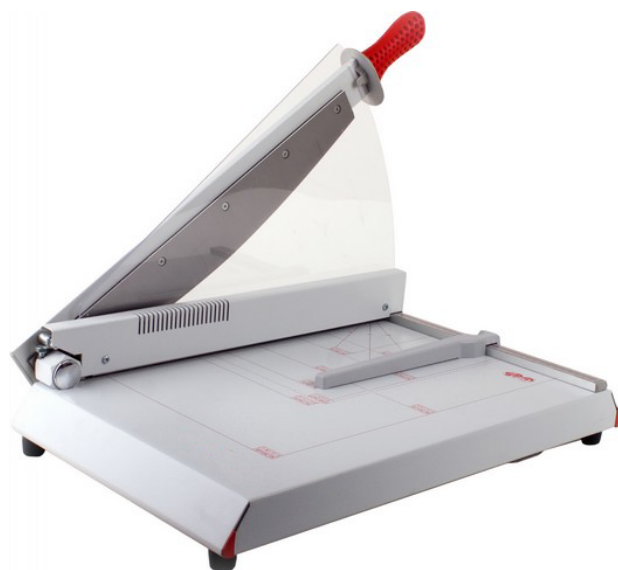
Dimensiones 440 C (An x Pr x Al) 685 x 395 x 500 mm Peso 10.6 Kg

Cizalla de palanca con pisón automático para un corte preciso y cómodo. Amplia mesa de sólida construcción totalmente metálica. Cuchillas reafilables de alta calidad hechas de acero reforzado. Protección fija de la cuchilla de color transparente con indicador de línea de corte integrado para un alineamiento exacto del papel a cortar. Tope lateral de precisión y escuadra trasera ajustable. Ancho de corte 440 mm. Capacidad de corte hasta 40 / 35 hojas. Grosor de corte 4 mm. Escala de medidas en mm / pulgadas.