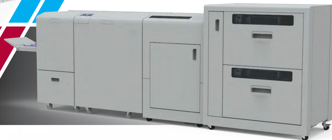
Serie BM4035/BM4050 con alimentador VFX