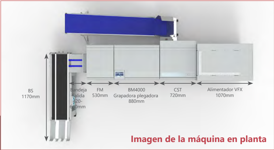
Imagen de la máquina en planta