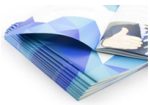
Grapado con acabado profesional